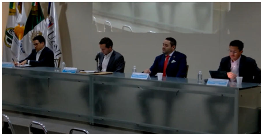
Jornadas de compliance e integridad empresarial

Los días 17 y 18 de Octubre, el Secretario Técnico y personal de las direcciones de Políticas Públicas y de Asuntos Jurídicos, así como de la Unidad de Transparencia, asistieron a las “Jornadas de Compliance e Integridad Empresarial” impartidas en las instalaciones de la Facultad de Derecho y Criminología de la U.A.N.L.